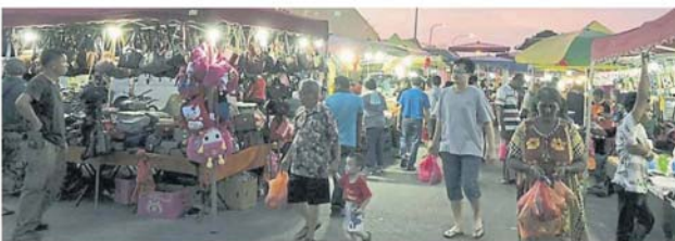
卫星市夜市物品琳琅满目，看得大家眼花缭乱。

“我希望有意在上述地段经营的小贩，直接向市议会申请合法租借档口，千万不要向任何一方购买转让档口，以免得不偿失。”