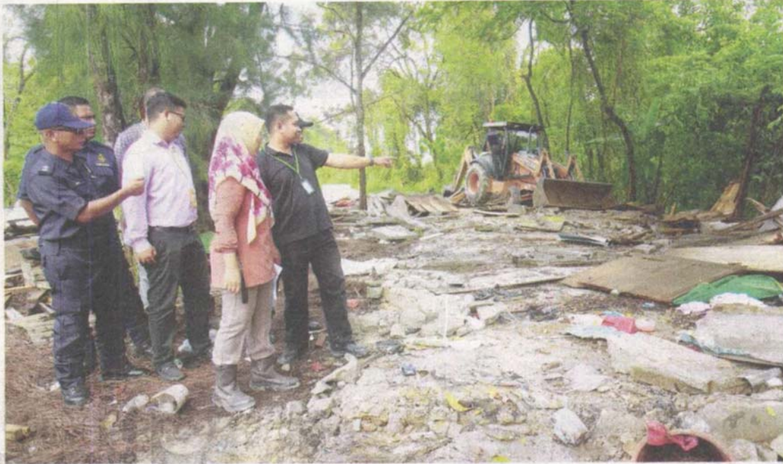
OPERASI bersepadu Pejabat Tanah Daerah Petaling bersama anggota MPSJ semasa operasi di Jalan Bukit Puchong 4/1 Bandar Bukit Puchong 4, Selangor, baru-baru ini.