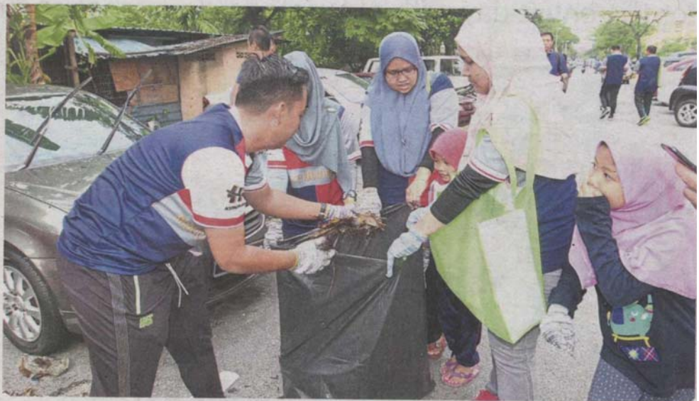
Residents of Taman Medan Cahaya flats in Petaling Jaya doing their part during the clean-up.

"Secondly, the Joint Management Body (JMB) of high-rise buildings and house owners should conduct their own regular checks to make sure there is no stagnant water