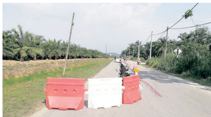
Permohonan untuk membaik pulih jalan mendap di Jalan Merbau, Kampung Bukit Hijau sudah dipanjangkan kepada JKR Selangor.

"Orang awam yang menggunakan laluan tersebut dinasihatkan supaya mematuhi arahan lalu lintas yang dikeluarkan kerana kawasan terbabit masih terlibat dengan projek menggantikan jambatan lama yang dijangka siap pada 2021," katanya.