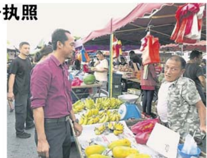
市议会官员上门拜访，向小贩了解经营事宜。

“另外，也有业者投诉到市议会不方便，我建议大家使用电子执照，一来可方便小贩交还清理费，二来也便于市议会管理，三来则在官员巡视时，可一并检查是否已摊还清理费和小贩档口租金等。”