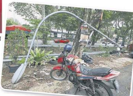
■ 厂家投诉，他们多次向市议会投诉灯柱遭压毁，可是过了几个月，情况依旧，没有任何单位来处理。

他补充，凡是遭市议会围封的建筑物，任何人都不许在未经允许下擅自拆开封条，因此是属违法行为。