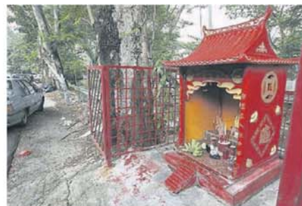
■ 神龕位置在路旁的空地，仅占了小小空间，没有阻碍任何交通。

们在不阻碍任何单位的情况下供奉神明这么久了，如今却突然被告知这是不合法的，非常不合理。”