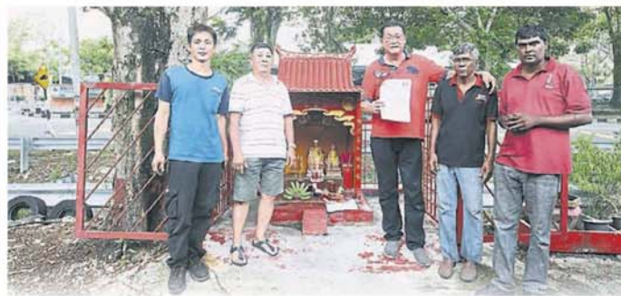
公神龕。 ■ 厂家不满市议会无故围封供奉多年的拿督