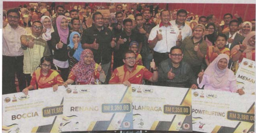
The Selangor para athletes gathering for a group photo with their mock cheques after the incentive award ceremony.

The Best Athlete and Manager winners each received RM500.