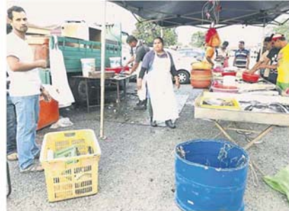
鱼档经营往往是地方政府最头痛问题，尤其非法业者给当地居民和商家带来各种民瘼。

他指出，希望重新规划早市和夜市经营地段后，可利于业者经营之余，也可解决目前所造成的民生困扰，比如卖鱼档口会安排在一起，以方便承包商清理。