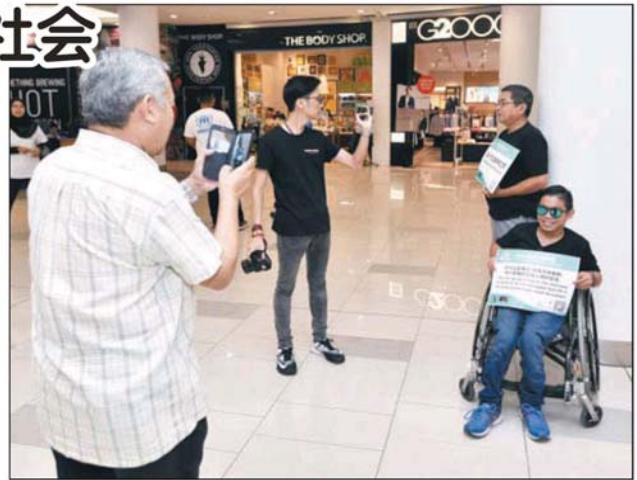
志工与障友齐「障健同行」，完成佰乐泰商场最后一站静默的醒觉运动。

该会早前在马六甲与吉隆坡站邀Youtuber郑斌彦参与体验「障健同行」生活，并预期第15