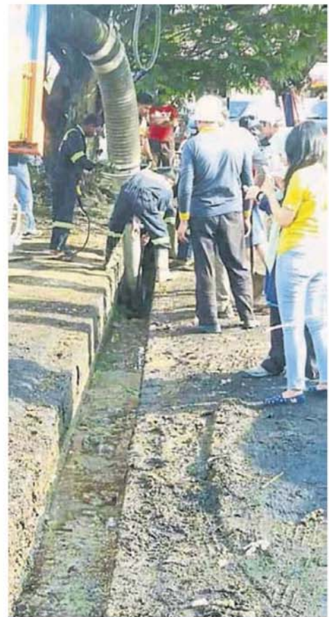
■沟渠油脂污迹堆积，影响排水。

她说，加影的商家若有需要可联络市议员，派人上门收取废油，若邻里有多家居民需要回收废油，也可以联系市议员。