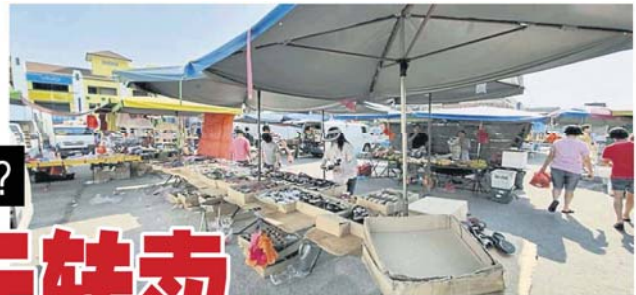
卫星市早市也吸引不少非法业者潜入经营。

的市议员黄智荣日前接获一名非法夜市小贩反映，有人想以8000令吉价位转让档口，让其可“光明正大”合法在夜市经营。