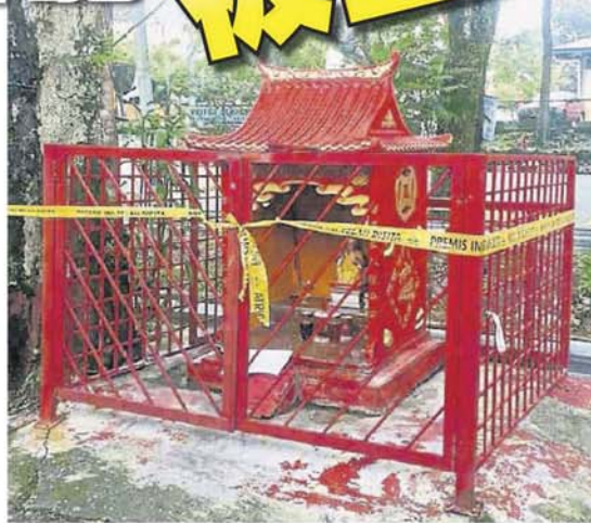
■ 位于鵝唛宝敦花园工业区的拿督公神龕遭士拉央市议会围封。

他说，神龕对面一整排工厂单位总共有10个单位，其中9个单位都是有供奉拿督公的华裔厂家，对于神龕无故遭围封的情况