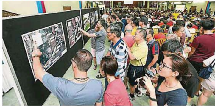
现场展示发展商计划的兴建高架桥计划图。