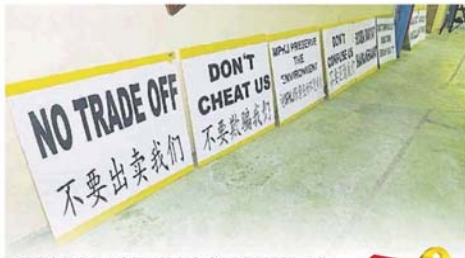
居民自行准备大字报，以表达对综合性计划的不满。