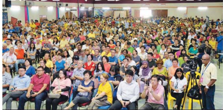
听证会吸引多达2000人来到双溪龙国中聆听，其中不少人更踊跃轮番发表意见和提问。

蕉赖皇冠城和双溪龙38个社区近2000名居民无法信服，认为本是市议会责任，为何如今却沦为如同与发展商等价交换的条件。