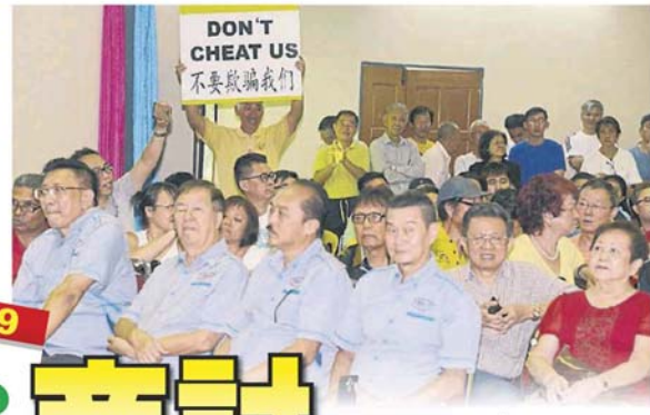
居民们都纷纷鼓掌认同。每遇有人高举「不要欺骗我们」等的大字报在场绕圈。