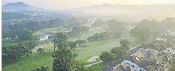
双溪龙居民希望高尔夫球场的绿肺可保留。

他也说，至于拉曼大学分校兴建的事情，市议会至今不曾获得任何建议或计划书，以在学校保留地兴建建校。