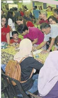
上千名来自双溪龙和皇冠城的居民踊跃出席听证会，以反映心声。