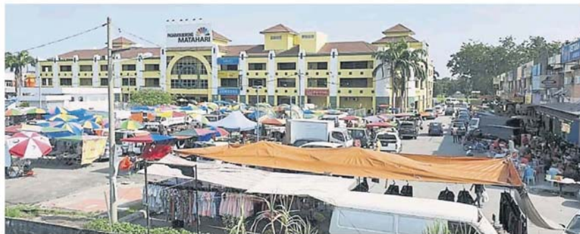
卫星市早市也带旺附近饮食业的经营。

想到有人却以此为生财工具。“实际上，有关交易并不利于买方，因为就算他们买下该档口，档口的注册名字仍不属于自己的，换言之，最终还是同样要战战兢兢作业。”