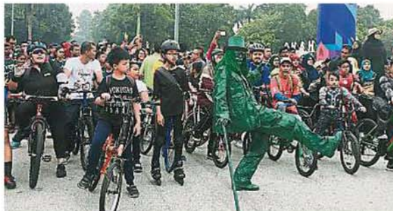
现场可见街头艺人与参与者互动，场面充满乐趣。

“至于巴生港口甘榜叻水闸河面出现白色泡沫的问题，目前已抽取水质化验，不过化验报告还没出炉。”