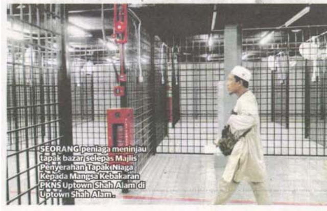
SEORANG peniaga meninjau tapak bazar selepas Majlis Penyerahan Tapak Niaga Kepada Mangsa Kebakaran PKNS Uptown Shah Alam di Uptown Shah Alam.

"Bagaimanapun kami harap para peniaga dapat mematuhi segala arahan yang dikeluarkan PKNS supaya kejadian kebakaran tidak berlaku lagi," katanya.