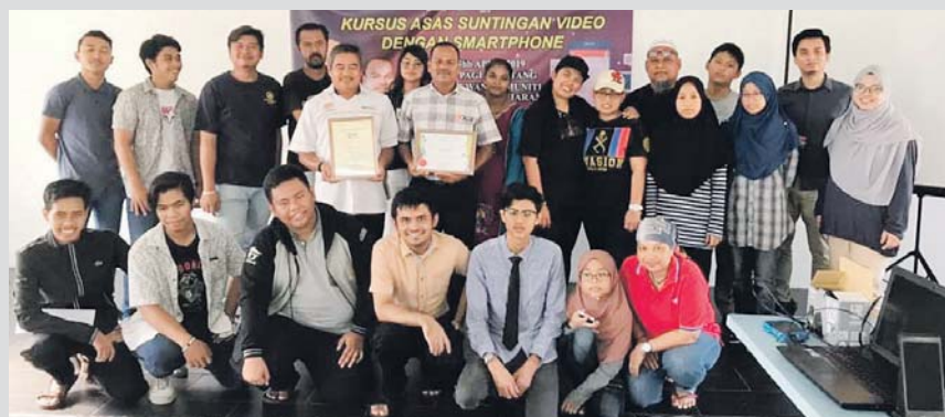
Antara yang hadir dalam kursus suntingan asas video melalui telefon pintar.

“Saya berharap golongan belia ini tidak menyalahgunakan teknologi yang ada di dalam telefon pintar, tetapi guna untuk menambah pendapatan sampingan,” katanya.