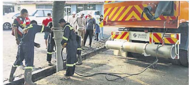
抽吸式清沟车抽吸混有悬浮堆积的油脂污渍，并射水疏通沟渠。